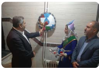
نواخته شدن زنگ آب در مدارس دهگلان و دیواندره