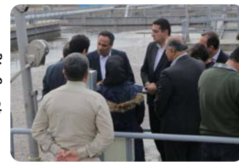
بازدید مدیرعامل شرکت مهندسی آبفا کشور از پروژه های آبفا کردستان