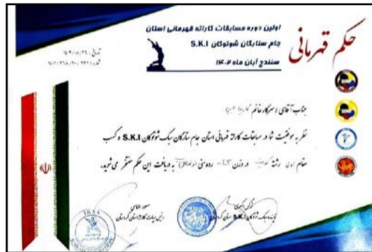
کسب مقاوم اول مسابقات کاراته قهرمانی کردستان توسط کارینا حبیبی فرزند همکار آبفا دهگلان حسین حبیبی