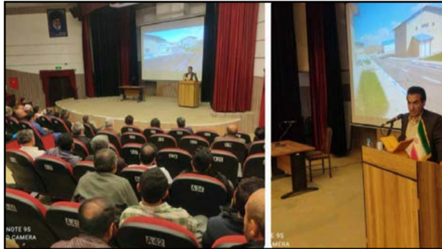
برگزاری دوره آموزشی توجیهی برای آبداران در شهرستان های سنندج، دهگلان، دیواندره و سروآباد