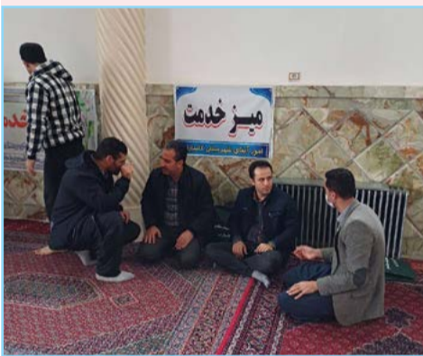
برگزاری میز خدمت امور آبفا دیواندره و کامیاران