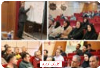
برگزاری ۲ دوره آموزشی مشترک صنعت آب و برق استان