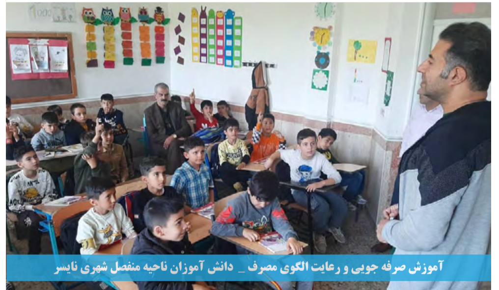
آموزش صرفه جویی و رعایت الگوی مصرف _ دانش آموزان ناحیه منفصل شهری نایس